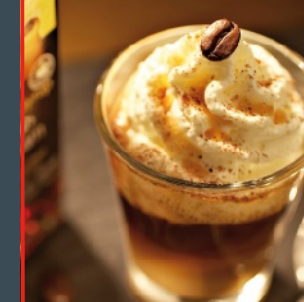
Arrange Latte Macchiato